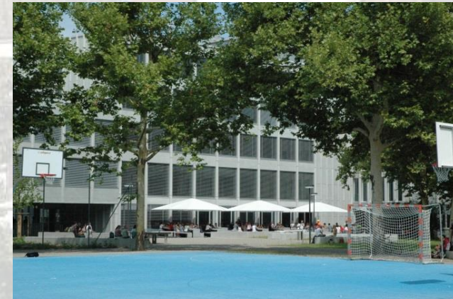
Gymnasium Bäumlihof EG 024