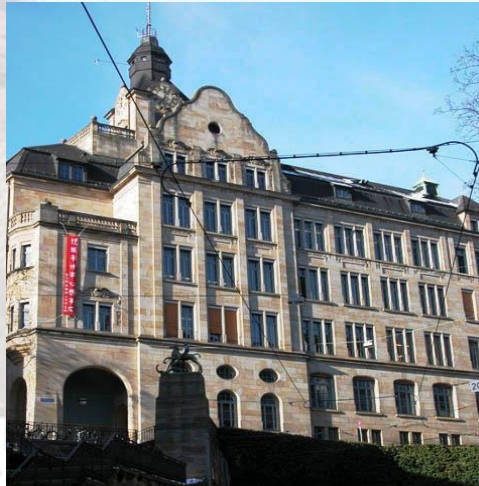
Gymnasium Leonhard EG 018