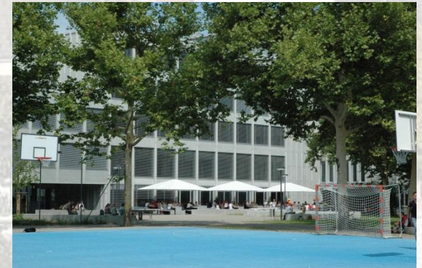
Gymnasium Bäumlhof GB Urban Rieger