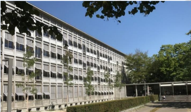
Gymnasium Kirschgarten Aula