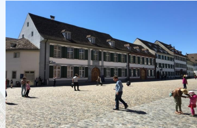
Gymnasium Münsterplatz EG 022