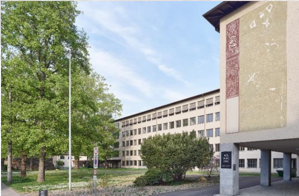
Wirtschaftsgymnasium EG 026