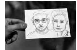
Postkarten in verschiedensten Techniken und Variationen an der BG-Biennale

Bereits zum fünften Mal gab es am GKG eine BG-Biennale. An diesem alle zwei Jahre stattfindenden Anlass steht das bildnerische Gestalten in verschiedenen Facetten im Zentrum.