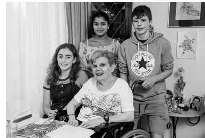
Begegnungen und Gespräche zwischen den Generationen