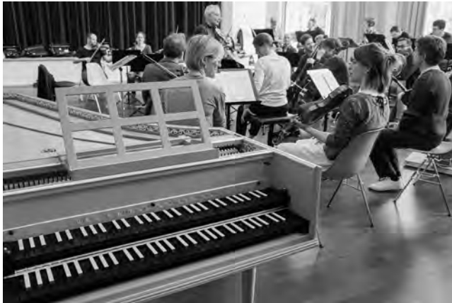
Offener Probenbetrieb: Das Kammerorchester Basel in der Aula des GKG