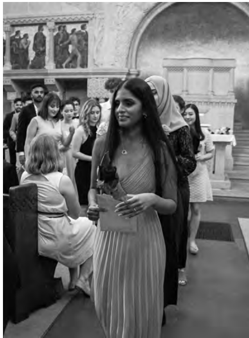
Eindrücke von der Maturfeier in der Pauluskirche