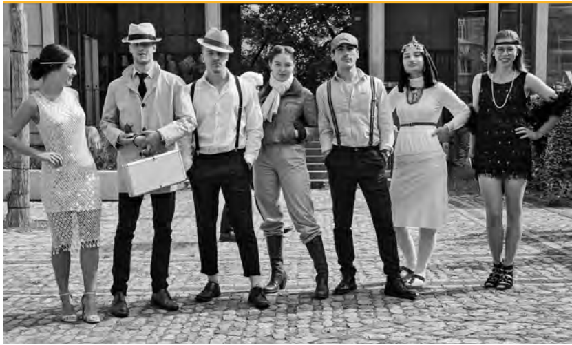
«Roaring Twenties» in der Mottowoche