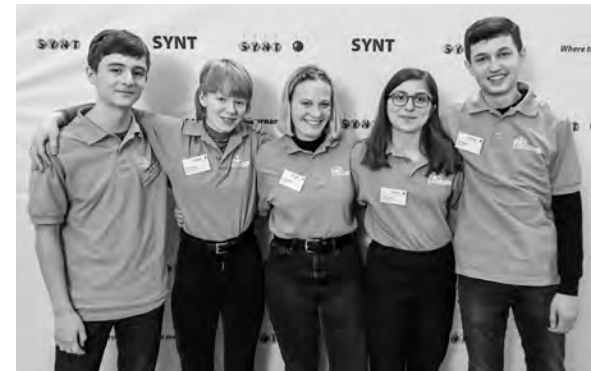
Schülerinnen und Schüler des GKG am Swiss Young Physicists' Tournament SYPT