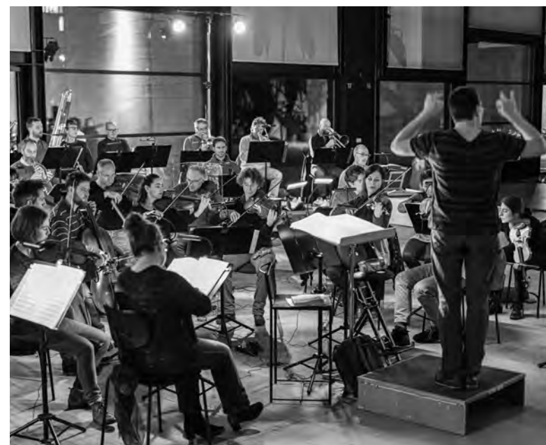
Aufführung der Schöpfung Reloaded im Museum Tinguely