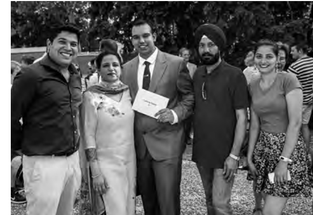
Geschafft! Maturfeier ist auch Familienfeier