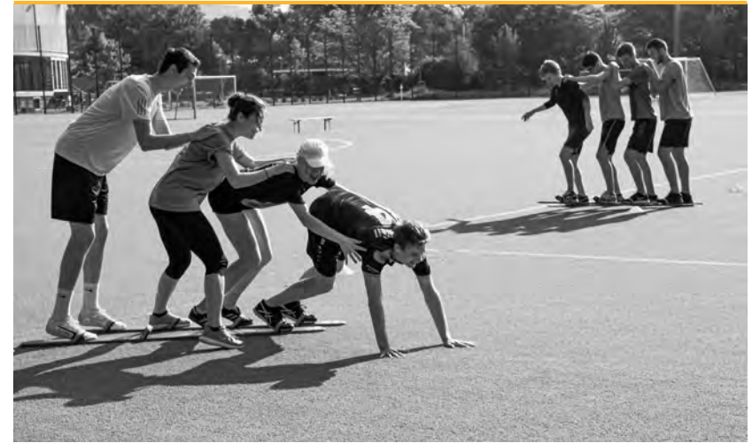
Sporttag am GKG